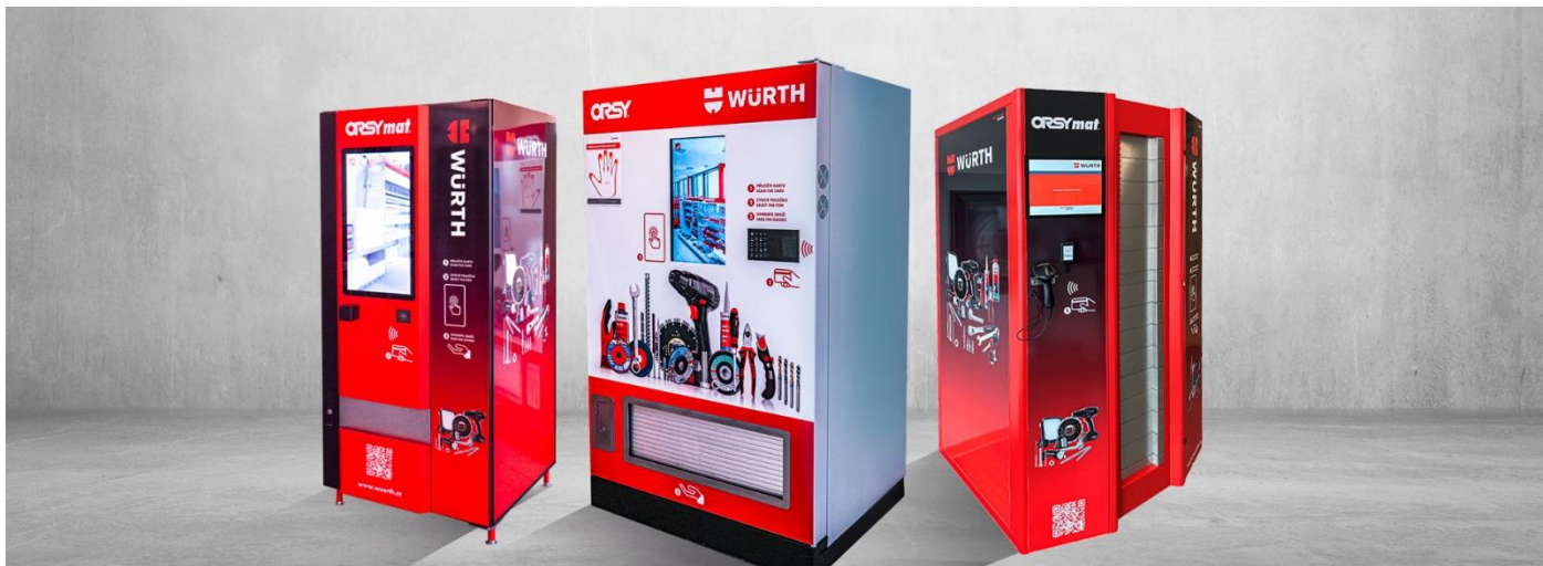
Obr. 1: Würth prostřednictvím výdejních automatů ORSY@ poskytuje výrobním závodům řešení adresné distribuce nářadí, pracovních pomůcek a spotřebního materiálu.

doplňován, čímž je zajištěna neustálá dostupnost potřebného materiálu," uzavírá Filip Kašpárek, eBusiness manager společnosti Würth Česká republika.