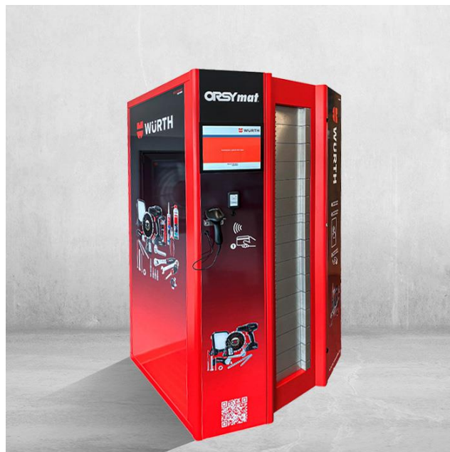
Obr.3: Provozům spoří až 80 % logistických nákladů.